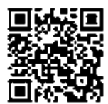
QRコードより十善戒の詳細がご覧いただけます